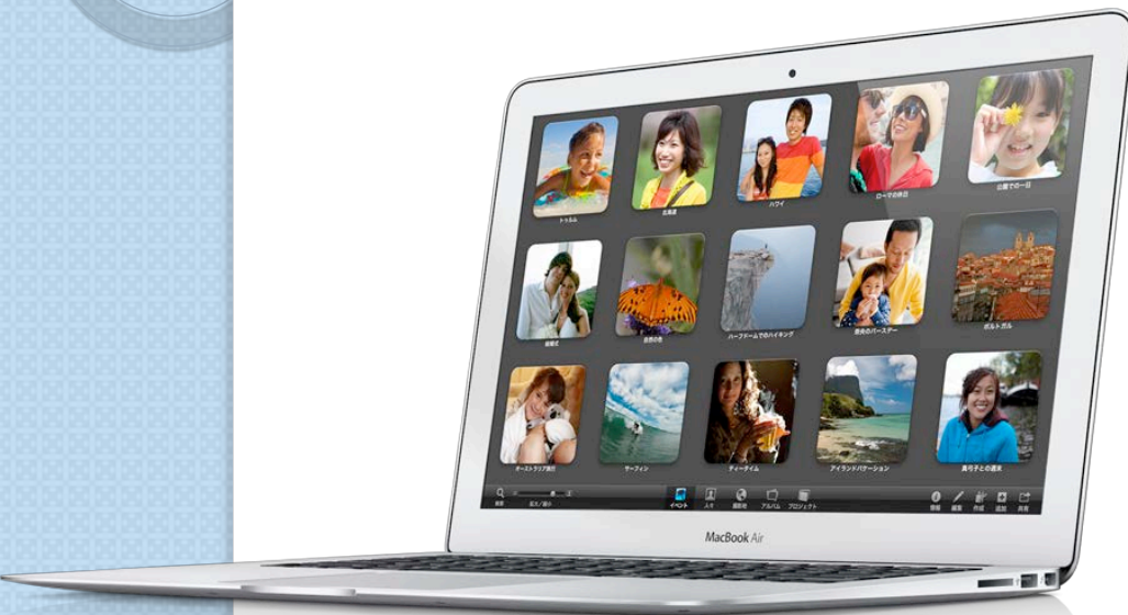
Macbook Air など